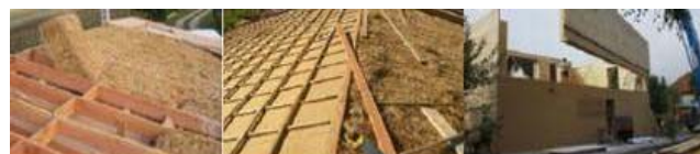
Les bottes de paille sont entrées dans les caissons qui servent aussi de porteurs pour la charpente.

La SA des Chalets : Réalisation en 2007 de cinq logements sociaux, à Lacaugne en Haute-Garonne , sous la forme de maisons de village mitoyennes dans une conception architecturale dans un souci de développement durable avec des moyens et des procédés novateurs, notamment des murs périphériques faits d'un complexe isolant constitué de bardage de bois, de panneaux pare pluie rigides, de feutre de bois, de bottes de paille de 35 cm et de plaques de fermacell avec un vide d'air ventilé.