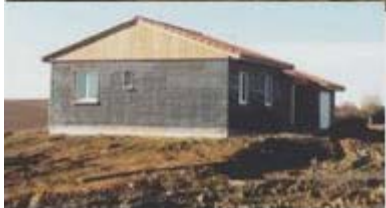
La Cité Jardins, Montesquieu Guittaut, 1998

Le Comité National de Développement du Bois a organisé une conférence sur la construction en ossature bois le 14 décembre dernier. La conférence était organisée en partenariat avec l'USH Midi-Pyrénées et Midi-Pyrénées Bois.