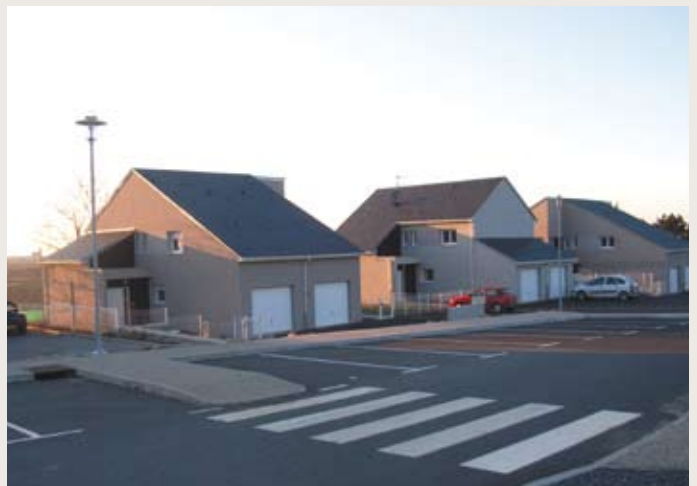
CHAMP DU MOULIN 2 : 6 logements individuels sur les 23 logements gérés par l'OPH de Rodez sur la commune de Sainte-Radegonde