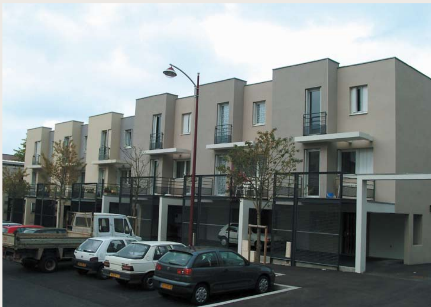
BOURRAN : 33 des 1005 logements gérés par l'OPH de Rodez sur la commune de Rodez

Bonne nouvelle, les huit communes du Grand-Rodez seront bientôt pourvues de logements réalisés et gérés par l'Office Public d'Habitat de Rodez. Le projet qui est en cours à Druelle permettra en effet de l'affirmer. En attendant la livraison de ces nouveaux logements, faisons ensemble un petit tour d'horizon du patrimoine de l'OPH de Rodez, en images !