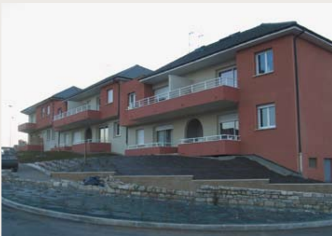
LES CAYRES : 12 des 24 logements gérés par l'OPH de Rodez sur la commune de Sebazac