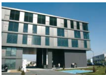
L'OPHLM de la Haute-Garonne devient OPH

Partager les expériences et réaffirmer les missions du mouvement Hlm, voilà les axes qui ont charpenté, en septembre dernier, le Congrès de l'Union Sociale pour l'Habitat. À l'issue de trois jours de travail, le Congrès de Cannes qui a réuni plus de 8 000 personnes a adopté le Projet pour le Mouvement Hlm. Ce projet réaffirme les missions d'intérêt général inhérentes aux organismes en charge du logement et de la cohésion sociale. C'est également le moyen d'engager des propositions concrètes sur le terrain du développement durable, des mesures de résultats, de la transparence des attributions des logements ou encore de la coopération entre les organismes. Le Congrès a voulu alerter les pouvoirs publics sur l'importance et le rôle des moyens budgétaires accordés par l'État. En effet, les fonds publics sont indispensables à la satisfaction des besoins ou encore à la modernisation du patrimoine. Le prochain congrès de l'Union Sociale pour l'Habitat se tiendra à Toulouse en septembre prochain (cf. agenda ci-contre).