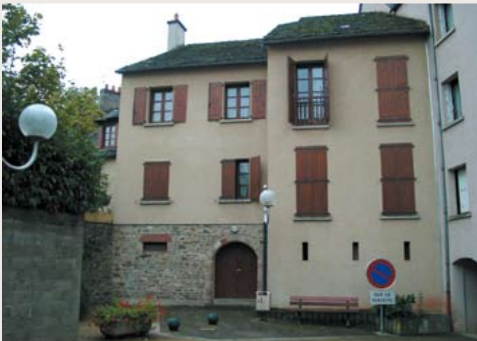
RÉSIDENCE SAINT-BLAISE regroupe les 4 logements gérés par l'OPH de Rodez sur la commune de Monastère