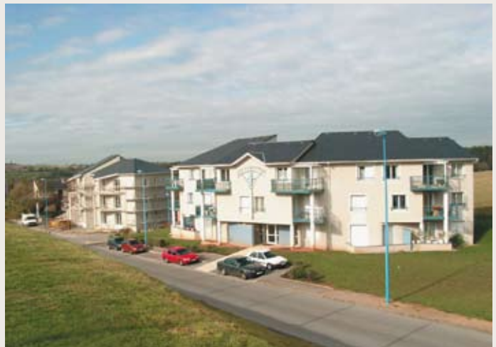
LES ALBATROS AUX COSTES ROUGES : 15 des 859 logements gérés par l'OPH de Rodez sur la commune de Onet-le-Château