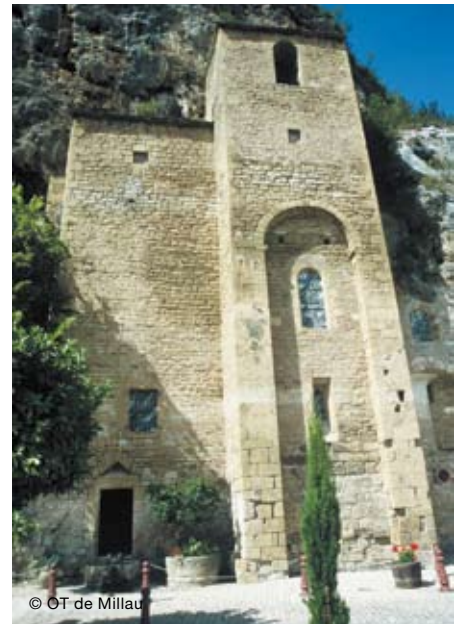
La commune de Peyre, très renommée.

hautes des grottes servirent même de refuge et de forteresse à quelques 3000 personnes pour faire face aux intrusions répétées des Normands.