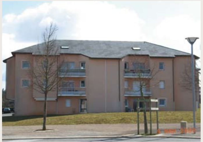
LE MANOIR regroupe les 30 logements gérés par l'OPH de Rodez sur la commune d' Olemps