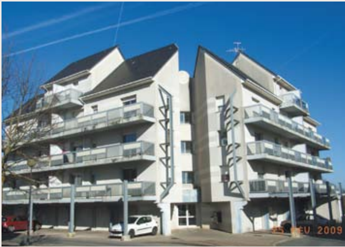
RÉSIDENCE L'ÉTOILE : 16 des 82 logements gérés par l'OPH de Rodez sur la commune de Luc-La-Primaube