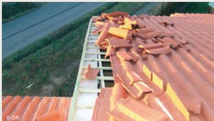
D'importants travaux s'imposent après le passage de la tempête Klaus.