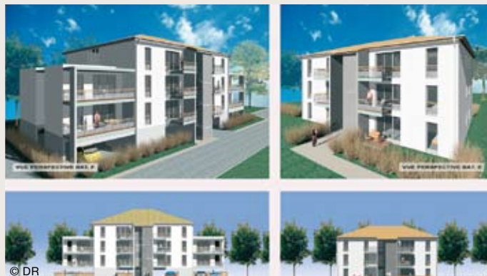
Vues du projet de rénovation et extension de la résidence Ajanta.