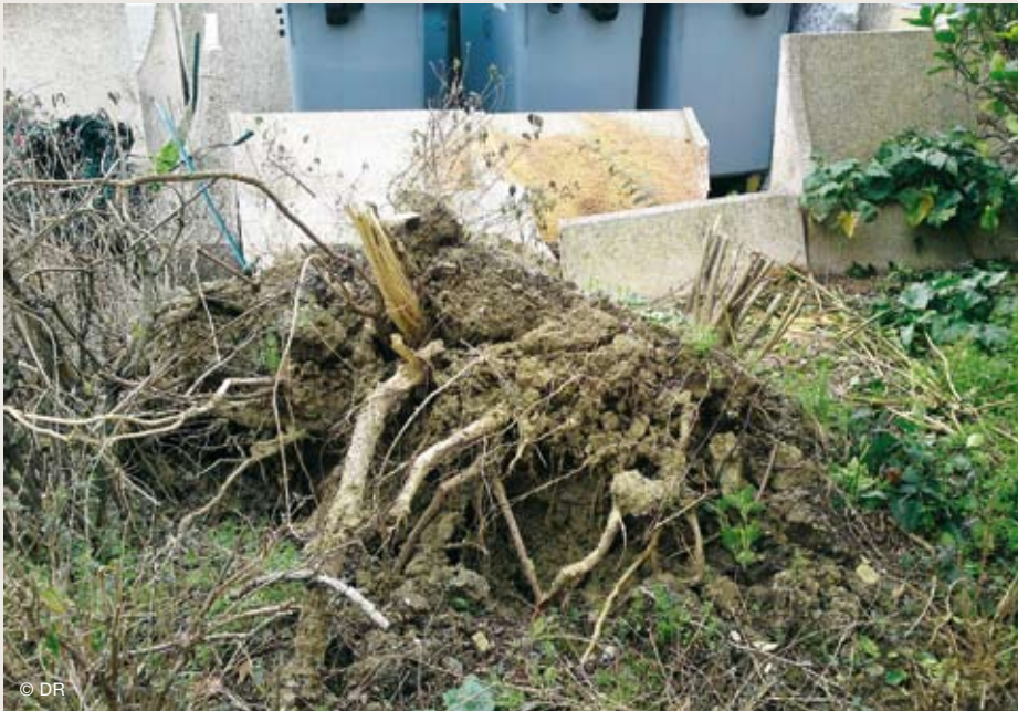
Les vents violents de la tempête Klaus ont touché durement le patrimoine de la Cité Jardins.