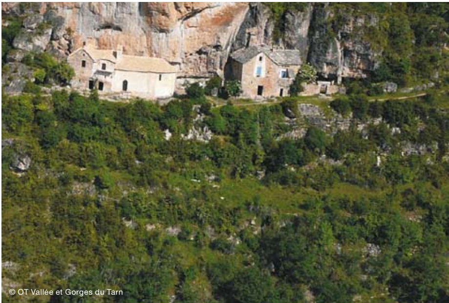
Le site de Saint-Marcellin.