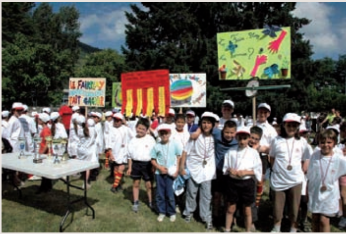
Après l'effort, le réconfort avec la sacro-sainte remise des récompenses. Les pancartes sur le thème du fair-play sont également fièrement exhibées.