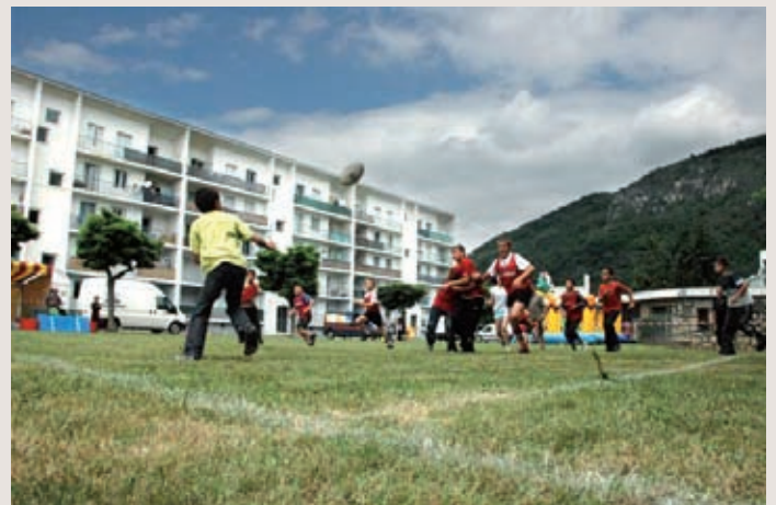
Au cœur des barres HLM de la résidence « Le Courbet » à Foix, les enfants se sont bien démenés durant cette journée et ne se sont pas épargnés pour arriver à maîtriser le ballon ovale.

La résidence « Le Courbet » à Foix résonne encore des cris des quelques 150 enfants qui se sont affrontés en toute amitié lors de la désormais traditionnelle journée « Rugby cité » organisée par l'Office Public de l'Habitat de l'Ariège avec le concours des Francas du Pays de Foix, de l'Union Sportive Fuxéenne (USF) et le soutien matériel de la Mairie de Foix. Les animateurs venus des différents CLAE ainsi que les personnels municipaux d'animation pédagogique ont encadré les élèves des écoles publiques Foix – Le Courbet, Foix – Les Bruilhols, Foix-Capitany, Foix-Cadirac, Foix-Le Cardié, Foix, Lucien-Go-