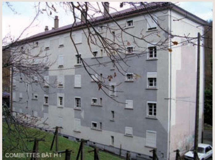
La Cité Vialarels à gauche et le bâtiment H et I de la Cité de Combettes à droite. Les deux immeubles dataient des années 50.