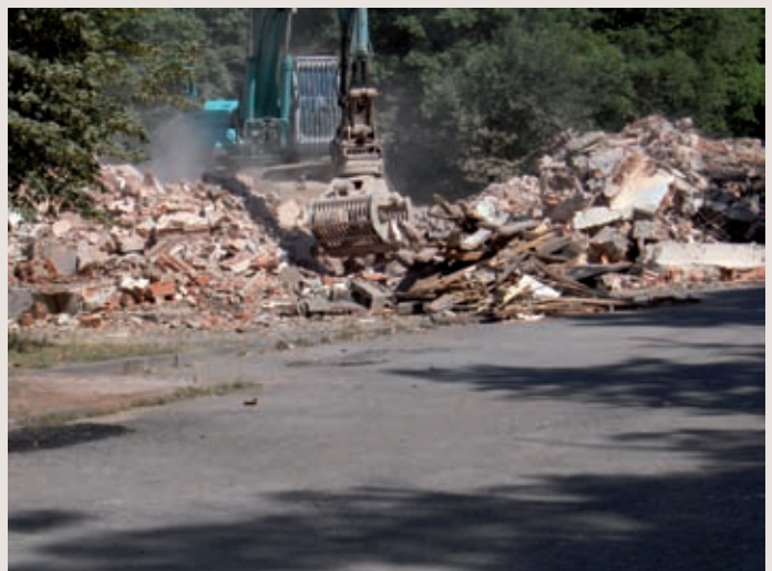
Les machines ont bien travaillé, des immeubles, il ne reste plus que des gravats.