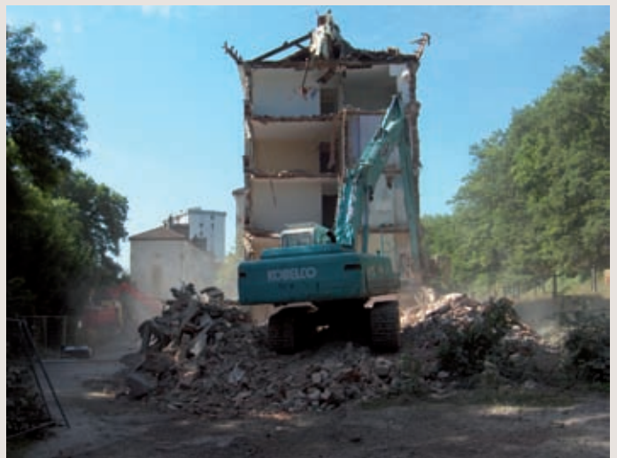
Quelques photos des immeubles éventrés, la démolition des immeubles s'est fait petit à petit.