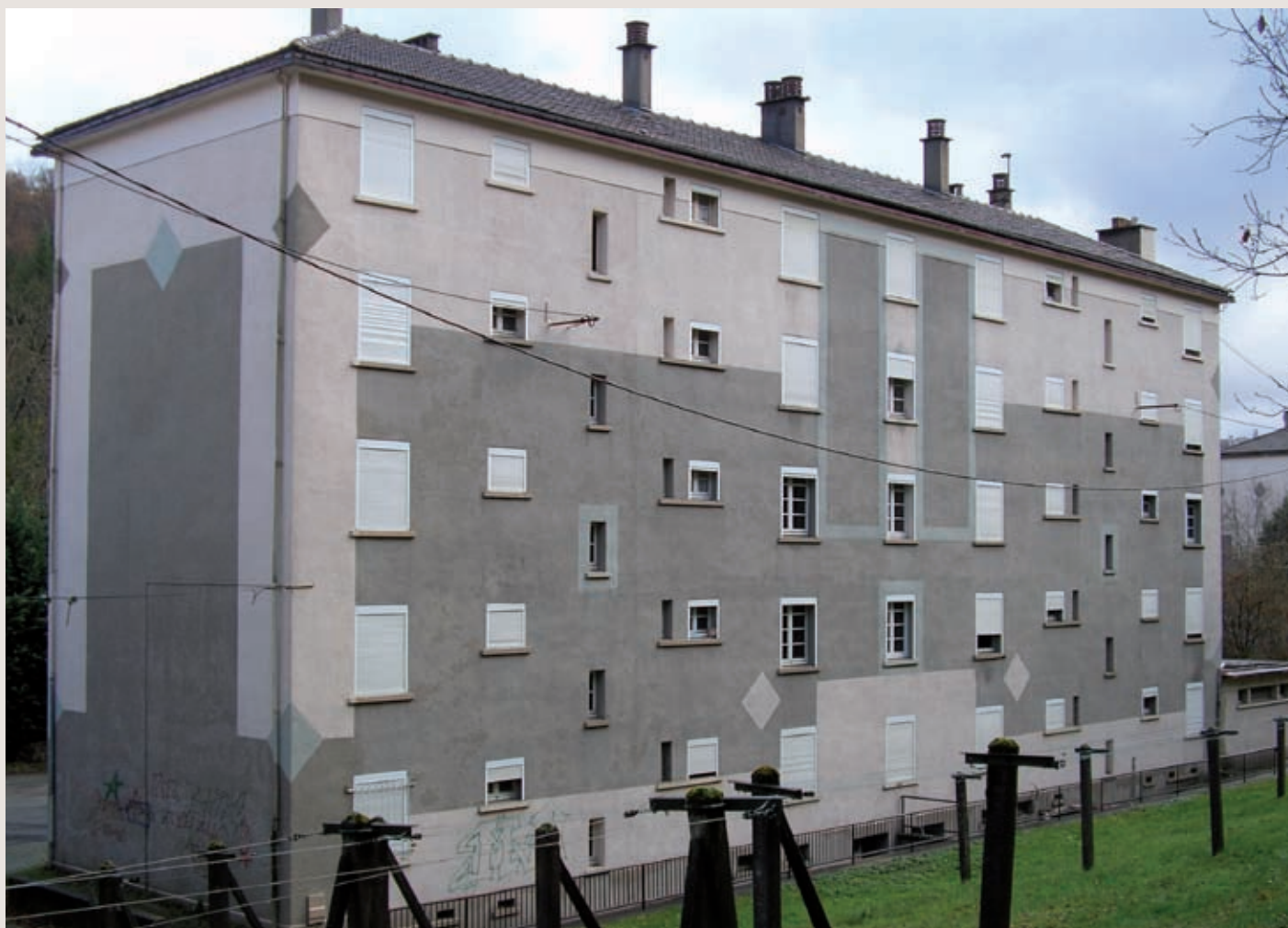
Le bâtiment F et G de la Cité des Combettes avant sa démolition.

En juillet dernier, deux bâtiments appartenant à l'Office Public de l'Habitat de Decazevilles ont fait l'objet de démolition. L'opération a concerné 40 logements de la Cité de Combettes (bâtiments F, G, H et I) et un immeuble de 10 logements dans la Cité Vialarels. Respectivement construits en 1958 et 1959, les bâtiments ne correspondaient plus aux demandes actuelles. Les travaux, effectués par l'entreprise S.D.T.P, ont coûté 100 000 euros (HT) et à l'heure actuelle, aucun projet de reconstruction n'est prévu. Le départ des habitants s'est fait petit à petit et il est à noter que les anciens locataires se sont tous vus proposés de nouveaux logements par l'Office de Decazeville.