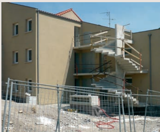
C'est par cet escalier en colimaçon que l'on accède aux appartements.