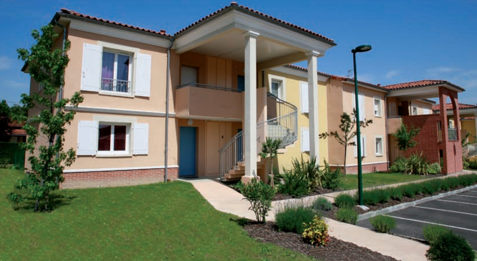
Résidence le Clos d'Ingrine à Escalquens.