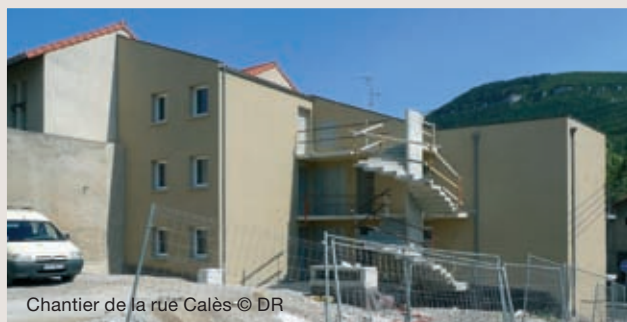
Chantier de la rue Calès