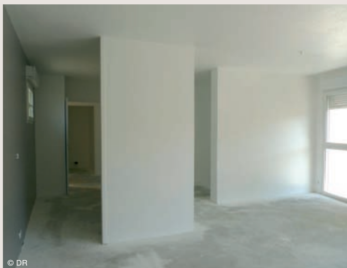
De grandes baies vitrées offrent une grande clarté au sein des appartements exposés plein sud.