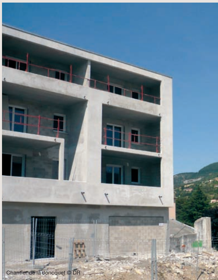
Chantier de la Joncquet