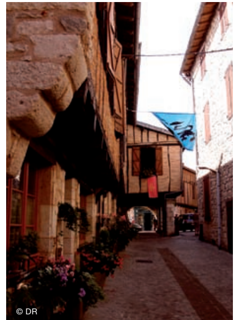
Cordes et ses ruelles escarpées est un village historique et culturel tout à fait pittoresque.