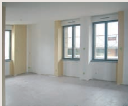
Le salon d'un futur T3.