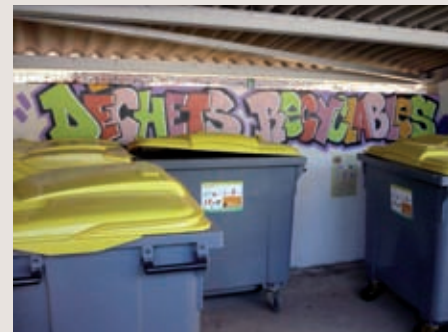
Le conteneur à ordures, décoré par les enfants de l'Accueil de Loisirs, est divisé en deux parties afin de sensibiliser les habitants au tri sélectif.

En concertation avec la Communauté d'Agglomération du Grand Rodez et le centre social et d'animation qui pilotait un projet d'animation de la vie sociale du quartier, l'Office Public de l'Habitat de Rodez a engagé les travaux d'aménagement de trois plateformes extérieures pour entreposer les conteneurs à ordures des immeubles du quartier Saint-Eloi à Rodez. L'opération concerne les 168 logements HLM répartis dans les cinq bâtiments que comprend le quartier. Les conteneurs à ordures ménagères ont été externalisés afin de supprimer les locaux prévus à cet effet à l'intérieur des bâtiments et