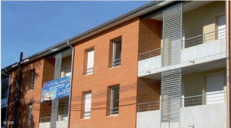
Le Clos Saint Porquier.

Livré en mai 2009, le clos Saint Porquier est un programme de 31 logements neufs alliant confort, sécurité et cadre de vie.