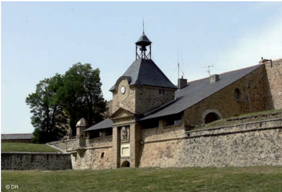
Mont-Louis / Castelnou.