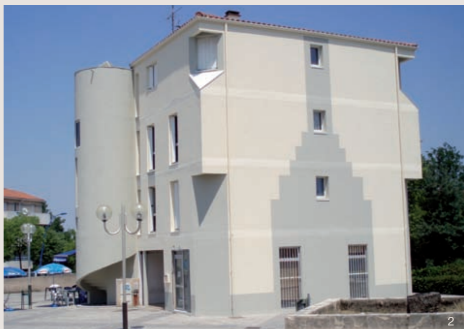
Photos 1 et 2 : Ravalement de façade pour la résidence du 34 boulevard Victor Hugo à Colomiers.