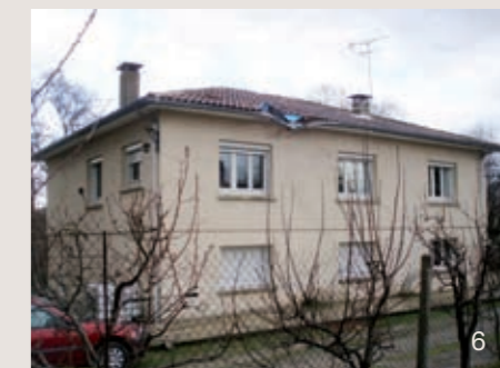
Photos 5 et 6 : Ce pavillon chemin Periac à Aussonne a totalement été rénové après son rachat par Colomiers Habitat.