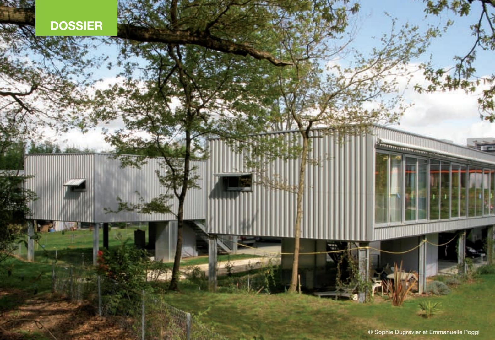
© Sophie Dugravier et Emmanuelle Poggi

Habiter autrement, Floirac (Bordeaux), Sophie Dugravier et Emmanuelle Poggi. Image tirée de l'exposition « Vers de nouveaux logements sociaux ».