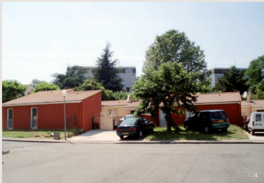
Photos 3 et 4 : Les pavillons de la résidence cabournas à Colomiers ont repris des couleurs suite à l'intervention des équipes techniques de Colomiers Habitat.