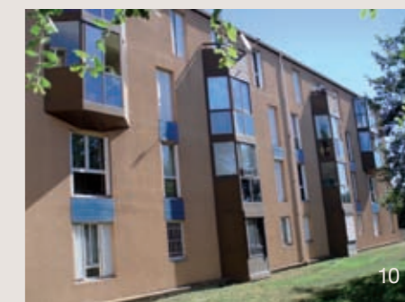
Photos 9 et 10 : Résidence Pahin construite en 1987 (logements). Rénovation de façades effectuée au 1 er trimestre 2009.