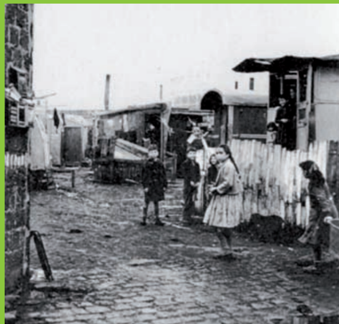
La construction de logements sociaux dans les années 30 ont permis à de nombreux Franciliens de quitter leur habitat insalubre, comme ici dans le malheureusement célèbre Bidonville du Cornillon.

Depuis sa création, le concept de logement social répond à une demande. Dès 1850, l'exode rural pose le problème du logement dans les grandes