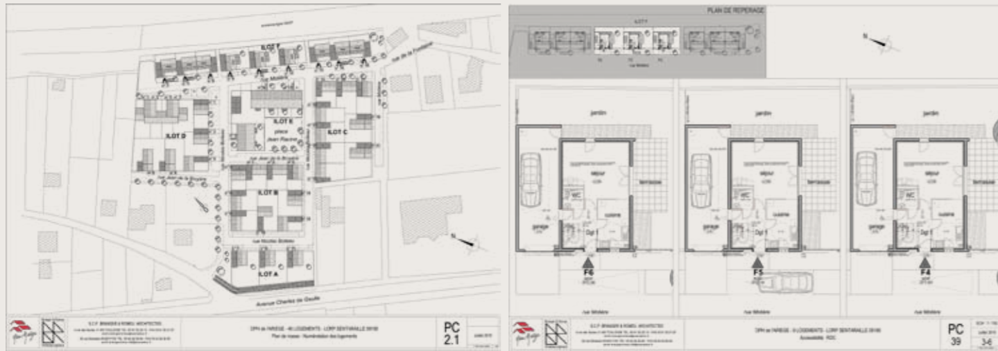
Les futurs logements viendront compléter ce petit village entre l'ancienne ligne SCNF et la rue Molière.

Après la récente livraison de 40 logements sur la commune de Lorp, l'Office Public de l'Habitat de l'Ariège se lance déjà dans la deuxième tranche du projet qui comprend la création de neuf nouveaux pavillons. Voici déjà les premiers plans des futurs logements. ■