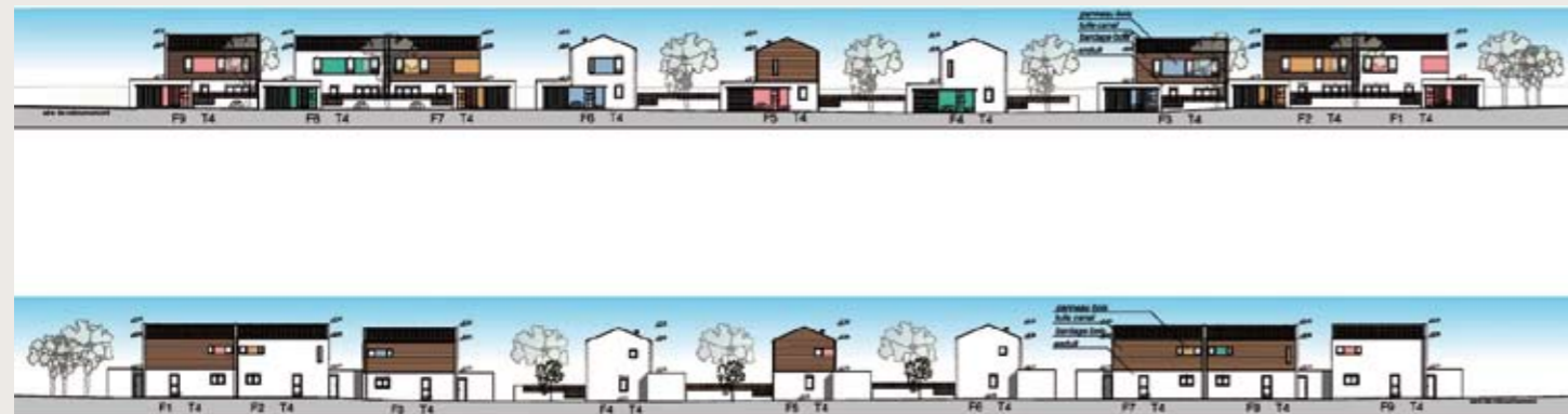
Les différentes façades des futurs bâtiments