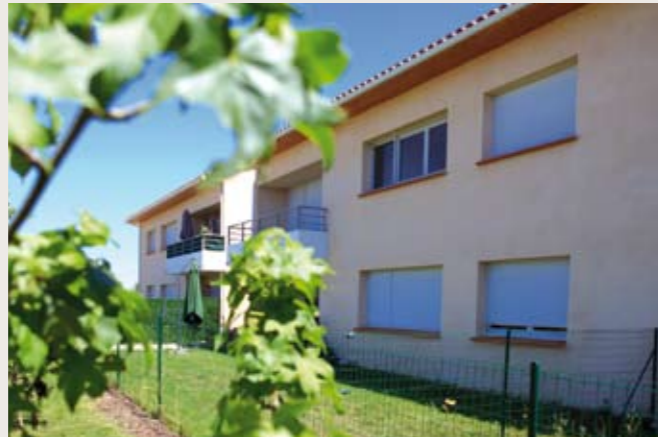
► FROUZINS Domaine de Tréville Livraison le 24 janvier de 32 appartements