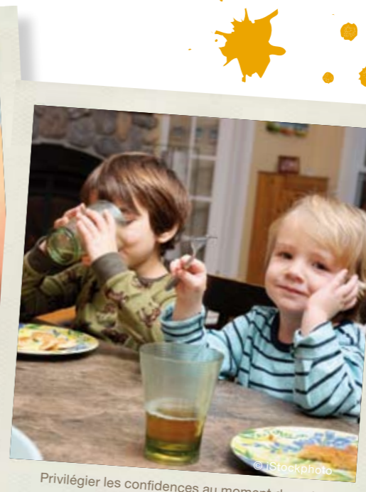
Privilégier les confidences au moment du goûter