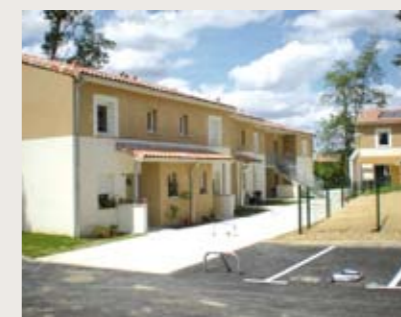
► LASSERRE La Prairie Livraison le 6 juin de 4 appartements et de 7 maisons individuelles