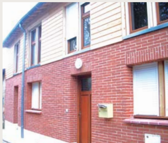
► CASTELNAU d'ESTRETEFONDS Coin de Nuciel Livraison le 14 février de 1 maison individuelle