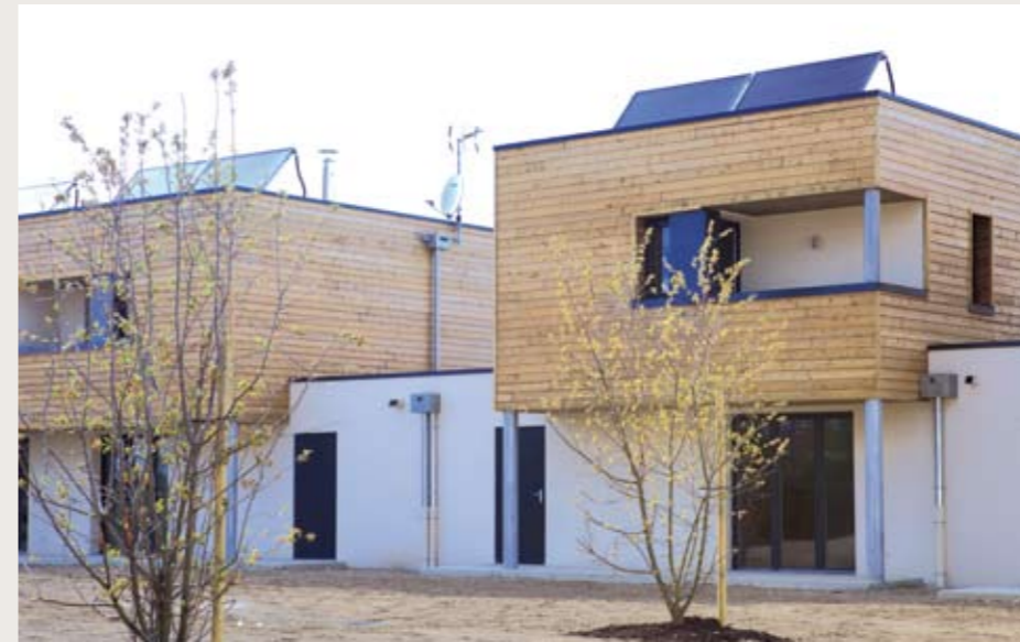
► COLOMIERS Henri Martin Livraison le 16 mai de 40 appartements et de 5 maisons individuelles