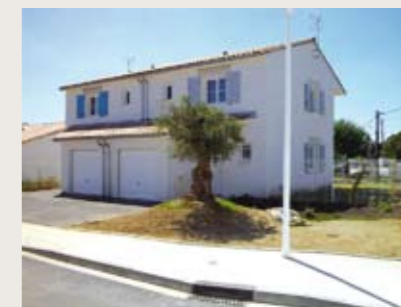
► VILLENEUVE TOLOSANE Le Clos Fleuri Livraison le 16 mai de 12 maisons individuelles