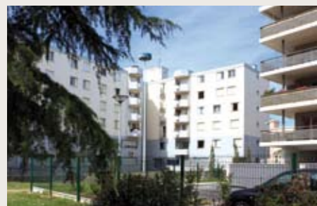
COLOMIERS Allée de Limogne Livraison le 1 er Janvier de 59 appartements