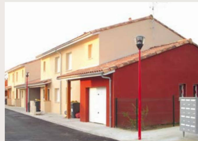
FONTENILLES ▼ Les Charmilles Livraison le 13 mai de 2 maisons individuelles