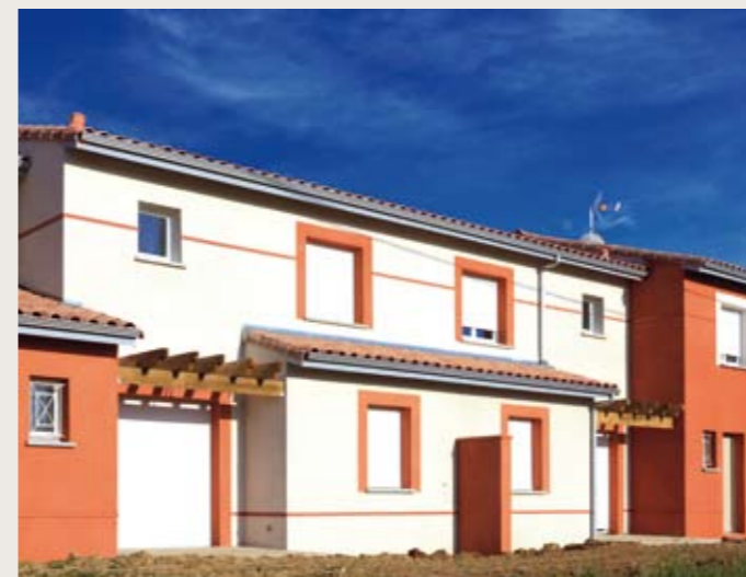
PIBRAC ▼ Bacot Livraison le 24 mai de 6 maisons individuelles