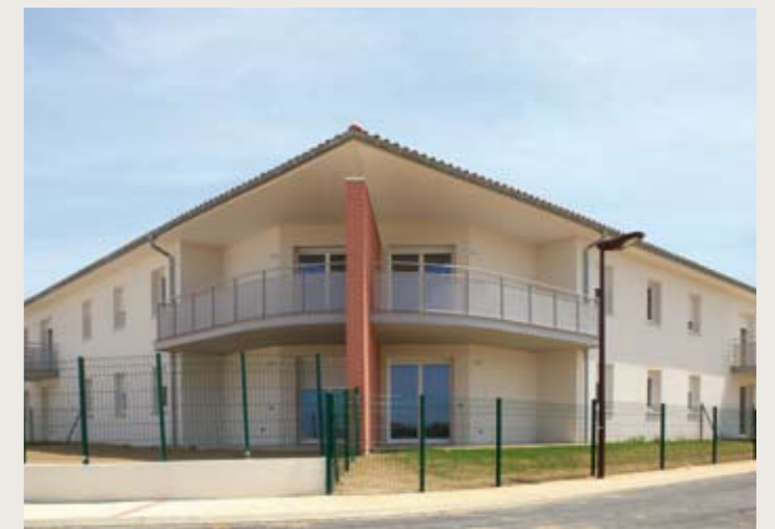
PIBRAC ▼ Les Hauts de Pibrac Livraison en juin de 13 appartements et de 10 maisons individuelles