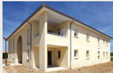
BRAX La Clairière Livraison en juin de 14 appartements

Toutes les livraisons du premier semestre en chiffres et en couleurs !