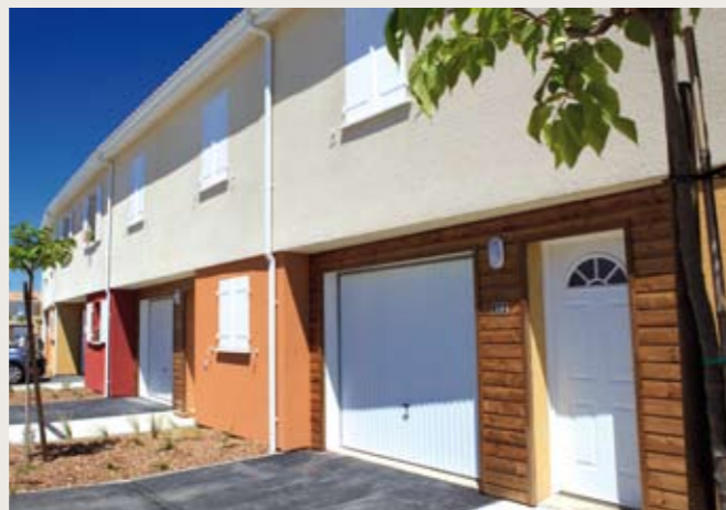
► CAZÈRES Domaine de Saint-Jean Livraison le 27 mai de 20 maisons individuelles