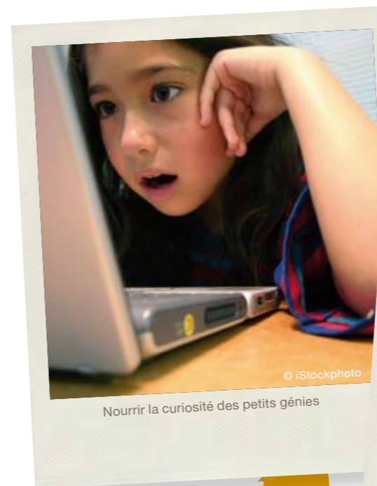
Nourrir la curiosité des petits génies

Certains enfants rentrent à la maison, d'autres participent aux activités des accueils de loisirs associés à l'école. Dans tous les cas, c'est le moment de prendre un goûter, avant 17 h. Attention, ce n'est pas un repas, mais une simple collation ! Il est important pour le corps d'éprouver la sensation de faim. À éviter, les boissons sucrées comme les sodas, ainsi que les pâtisseries et