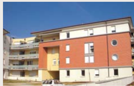
COLOMIERS Les Jardins de la Pépinière Livraison le 24 Janvier de 46 appartements