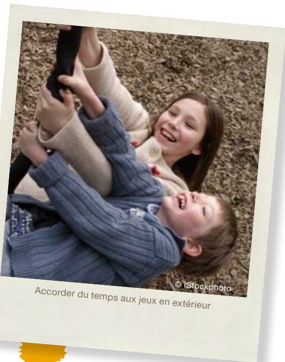
Accorder du temps aux jeux en extérieur