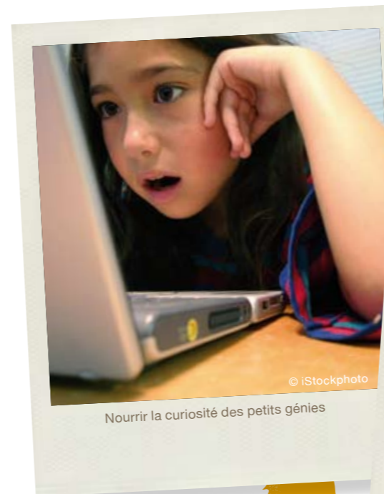
Nourrir la curiosité des petits génies

Certains enfants rentrent à la maison, d'autres participent aux activités des accueils de loisirs associés à l'école. Dans tous les cas, c'est le moment de prendre un goûter, avant 17 h. Attention, ce n'est pas un repas, mais une simple collation ! Il est important pour le corps d'éprouver la sensation de faim. À éviter, les boissons sucrées comme les sodas, ainsi que les pâtisseries et