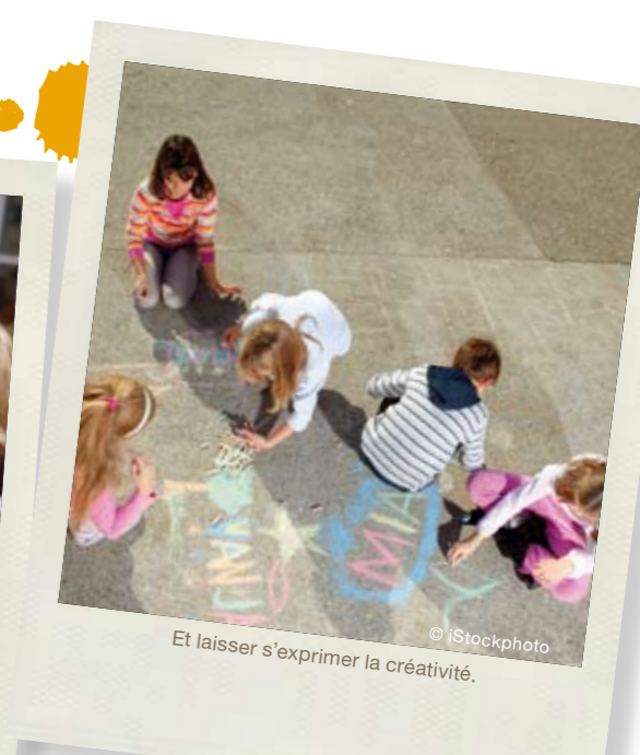
Et laisser s'exprimer la créativité.

autres biscuits industriels. Privilégier le pain, le chocolat et les fruits. S'il n'y a théoriquement pas de devoirs à la maison donnés à l'école primaire, l'arrivée au collège apporte un grand changement. Les enfants doivent s'organiser, accompagnés par leurs parents. Il faut répartir le temps de travail à la maison sur la semaine, afin de ne pas tout faire le dimanche à 17 h ! Les enfants doivent faire leurs devoirs avant 19 h, pour arriver à se concentrer, à la cuisine, par exemple, pendant que maman, ou papa, prépare le dîner. Les plus grands, à qui on fait confiance, peuvent travailler sur un bureau dans leur chambre. Dans tous les cas, les parents, même s'ils rentrent tard, doivent vérifier que les devoirs ont été faits. Les enfants peuvent ensuite s'accorder un moment de détente ou aller se doucher.