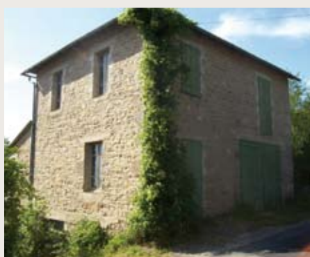
À Montjaux, la villa a pris un coup de jeune.

V ivre Aujourd'hui vous en parlait il y a quelques mois, l'OPH avait été mandaté par la Mairie de Montjaux pour transformer une villa en pleine campagne aveyronnaise en un logement social à joli potentiel. Une opération ayant de nombreux points communs avec celle réalisée à Peyreleau, ayant créé 3 logements en collectif : 2 T3 et un T2 en duplex au-dessus de la Mairie.