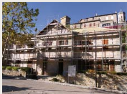
À Peyreleau, 3 logements neufs au-dessus de la Mairie.

Ces deux projets partagent également un choix énergétique à la fois confortable et économique : plancher chauffant électrique et poêle à bois.